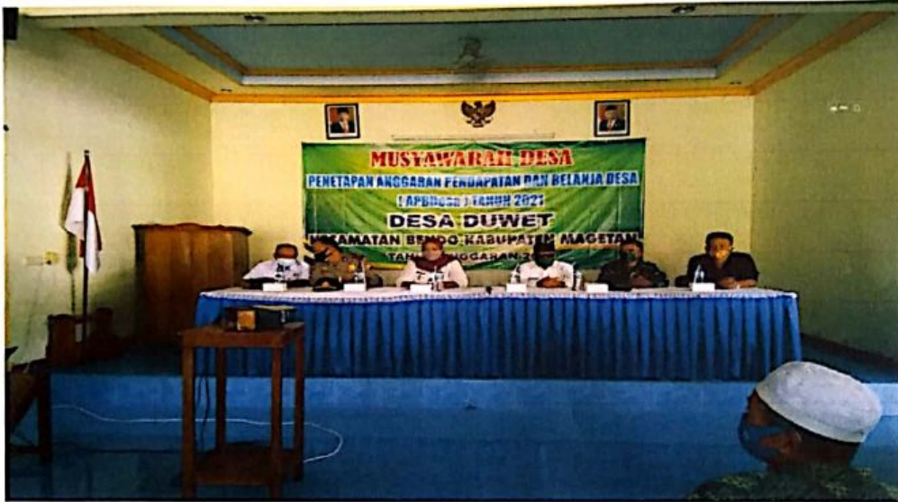
FOTO MUSYAWARAH DESA PENETAPAN ANGGARAN PENDAPATAN DAN BELANJA DESA (APBDesa) TAHUN 2021 DESA DUWET KECAMATAN BENDO KABUPATEN MAGETAN TAHUN ANGGARAN 2020